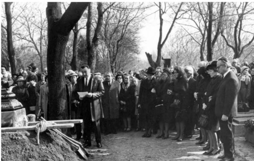
Sinkovits Imre színművész beszél Németh László temetésén, 1975-ben. A háttérben Aczél György.

Fontos tapasztalat volt ez a hatalommal zajló tárgyalás valós lehetőségeiről: „Az MDF alighanem legfontosabb közvetlen előzményének tekinthető az az