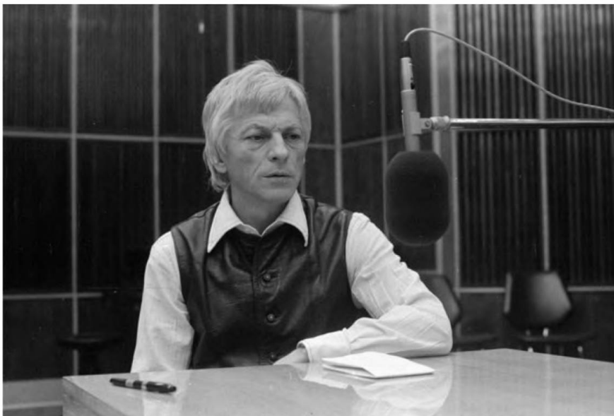
Nagy László költő a Magyar Rádió Kormos István emlékműsorában, 1977-ben.

Mindeközben hihetetlen szómágia zajlott a valóság és az önbecsülés rovására. A megaláztatásra adott válaszban „az ember valódi színvonala tűnik elő” 7 – fogalmazott Hamvas Béla az 1956-os forradalom kapcsán. A hatalom azonban ezt a forradalmat ellenforradalomnak hazudta, és e minősítést nemcsak a nép arcába vágta, hanem – folytatva a megaláztatásra épített uralmi forma gyakorlatát – meg is követelte e hazugság előtt való főhajtást. A magyar társadalmat ezzel „valódi színvonalának” elsumákolására kárhoztatta, a társadalom bűnbe kényszerítését pedig saját rendszerének