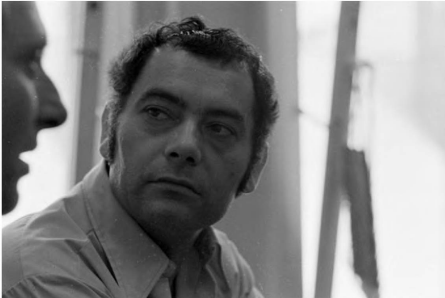
Csoóri Sándor Egy nomád értelmiségi című esszéjének sorsa sokatmondó esettanulmány az aczéli kultúrpolitikáról.

A Donáth Ferenc gondolata nyomán (az 1943-as szárszói konferencia mintájára szükség lenne egy értelmiségi találkozóra) megszülető monori találkozó ugyancsak a konzultációs fórum keretében szerveződött. Monor azonban a korábbi közös akciókhoz képest minőségi különbséget jelentett, mégpedig azért, mert annak már a jövőre vetülő jelentősége volt.